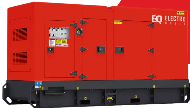
Illustratives Bild. Die tatsächlichen Produktdetails können von der Abbildung abweichen.