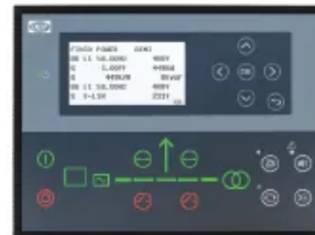
DEIF AGC 150

DEIF AGC 150 Alternative AMF-Controller-Option, typischerweise gewählt, wenn eine DEIF- basierte Steuerplattform für das Projekt bevorzugt wird.